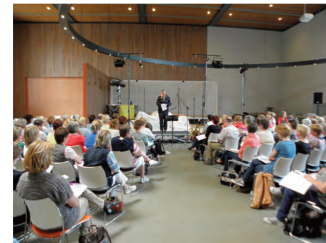
Het kon niet beter. Ruim 160 deelnemers bezochten het symposium Palliatieve zorg bij dementie.

Netwerksymposia zijn, behalve voor deskundigheidsbevordering, ook bedoeld voor zorgverleners (professionals en vrijwilligers) om elkaar te ontmoeten en ervaringen uit te wisselen.