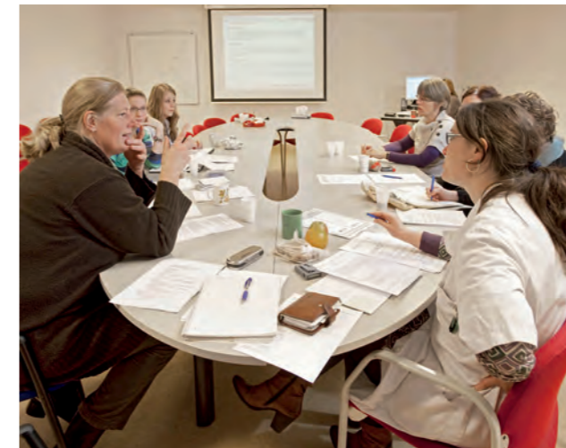
Palliatief adviesteam LUMC.